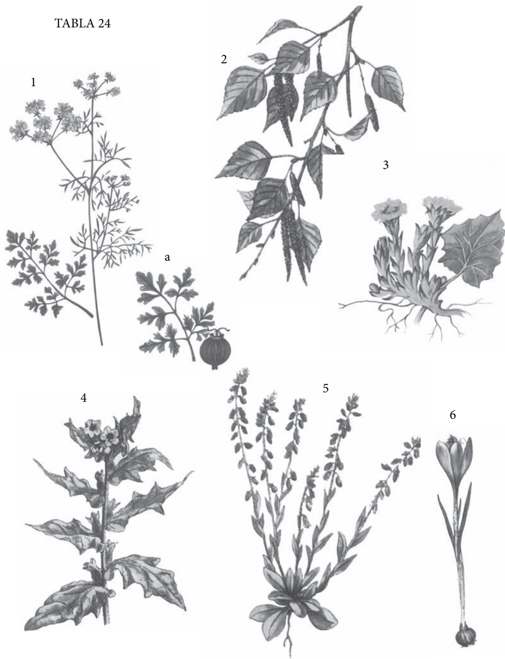
1 – korijandar ( Coriandrum sativum ), a – zreo plod; 2 – breza ( Betula alba ); 3 – podbel ( Tussilago farfara ); 4 – bunika ( Hyoscyamus niger ); 5 – kija ( Polygala amara ); 6 – šafran ( Crocus sativus ).