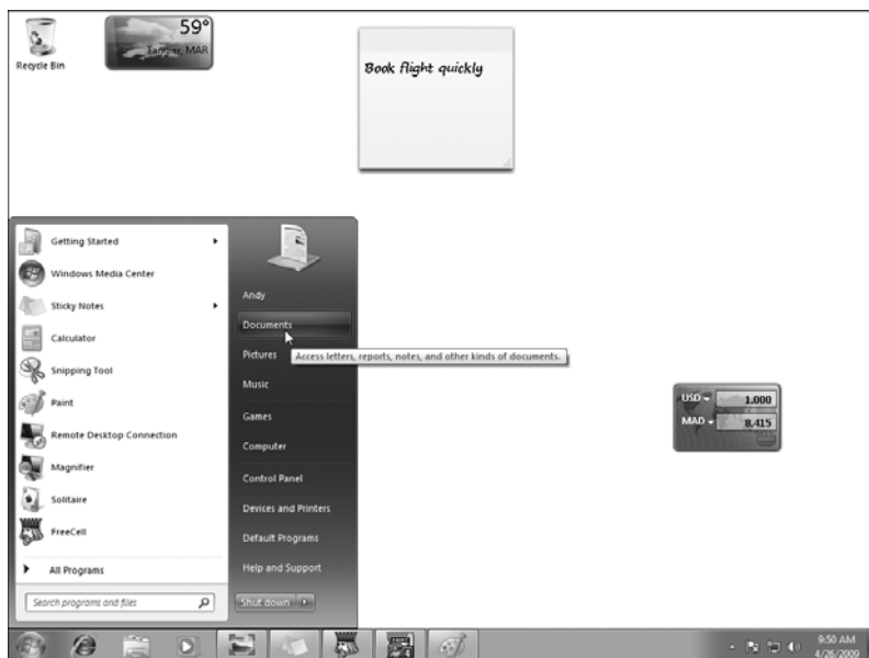
Slika 1-1: Windows 7, najnovija verzija Microsoftovog Windowsa, već je instaliran na većini novih PC računara.

Kao stroga majka koja pištaljkom poziva decu za sto, Windows upravlja svakim prozorom i delom vašeg računara. Kada isključujete računar, na ekranu se pojavljuje Windows i nadgleda rad tekućih programa. Tokom ove akcije, Windows omogućava da sve protekne glatko, pa čak i ako programi, poput nemirne dece, počnu da se gađaju hranom.