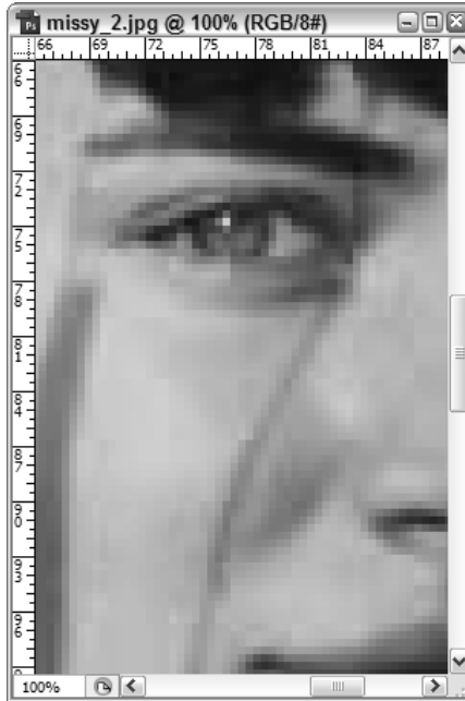
Slika 1.2: U originalnoj veličini, JPEG slika na levoj strani sasvim je oštra i jasna. Kada se poveća na 500% (desno), slika postaje nazubljena, tj. vide se pikseli.