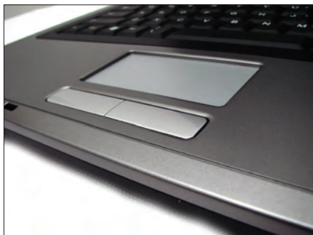
Slika 2-4: Pokazivačka pločica.