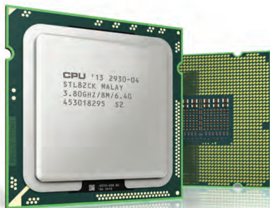
Slika 2-1: Procesor.