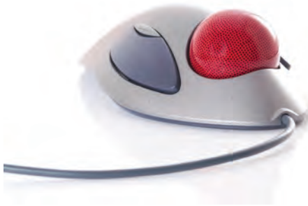
Slika 2-3: Pokazivačka kuglica.