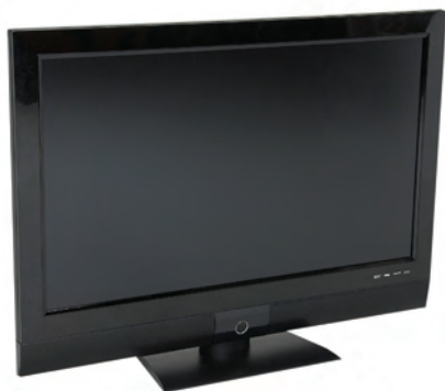
Slika 2-5: Monitor.

Svaki računar ima neku vrstu ekrana. Zavisno od tipa računara, ekran može biti ugrađen ili samostalna jedinica koja se zove monitor (slika 2-5) i ima sopstveni kabl za napajanje strujom. Neki ekrani su osetljivi na dodir (engl. touchscreen ). Na računarima s takvim ekranima, podaci se unose povlačenjem prsta.