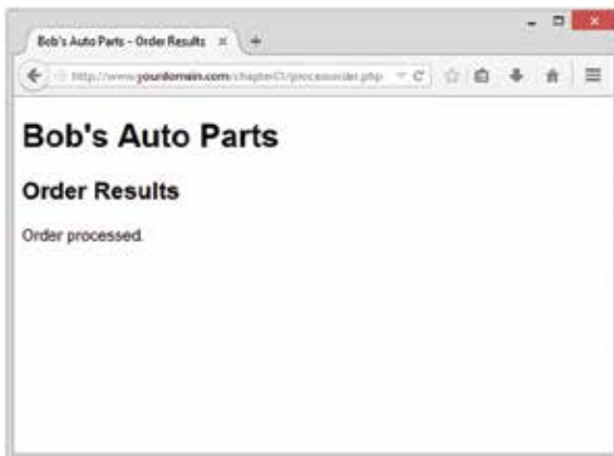
Slika 1.2 Tekst prosleđen PHP naredbi echo poslat je čitaču veba.

Snimite datoteku i pogledajte je u čitaču veba (engl. web browser ) tako što ćete popuniti obrazac i pritisnuti dugme Submit Order. Trebalo bi da se pojavi rezultat nalik na onaj sa slike 1.2.