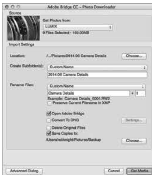
A Standardni okvir za dijalog u Photo Downloaderu.

Da biste kopije fotografija slali u zadat direktorijum ili na spoljni disk (kao rezervu), potvrdite opciju Save Copies To , pritisnite dugme Browse/Choose , izaberite lokaciju, pa pritisnite OK/Open. To će biti vaša prva rezervna kopija (engl. backup copy ).