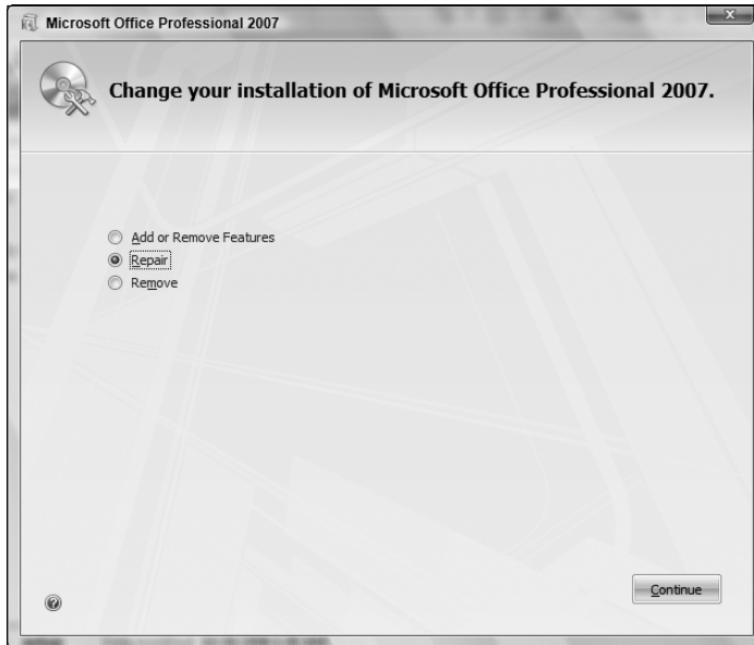
Slika B-3: Popravljanje Officeove instalacije.